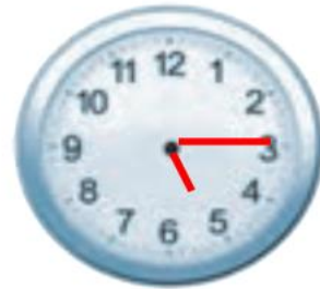
الْخَامِسَةُ وَ الرَّبْعُ