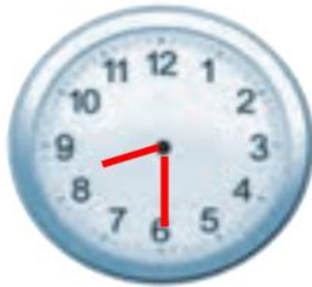
الثَّامِنَةُ وَ النُّصْفُ